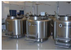
脐血干细胞储存在液态氮槽内