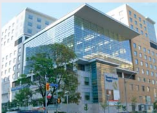
位于 TORONTO GENERAL HOSPITAL 的 Cells for Life 实验室

Cells for Life 会为医务专业人员提供带有 CME 学分的专业课程。我们的导师由颇具产科经验的 RN 组成, 对产科医生、助产士和医院职工提供正确采集脐血技术和如何使用采集包方面知识的培训。